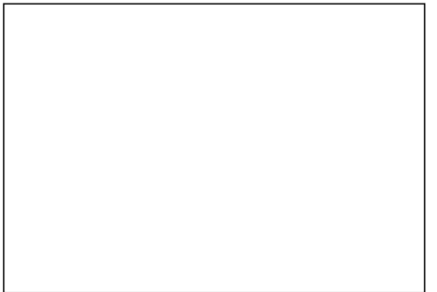
FC. KTP-el IBU