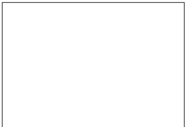
FC. KTP-el IBU